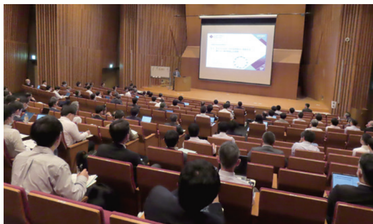
【2025年 工業会賞特別セッション（京都大学）】