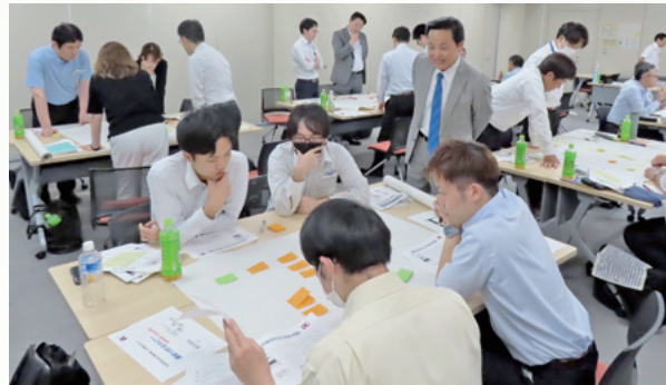
【2025 年セミナー グループ演習の様子】

本年度は、「現場作業の現状分析」をテーマとして演習を行います。事務系・技術系を問わず受講いただけますので、ぜひ奮ってご参加ください。